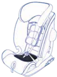
Figura 1. Posizionamento dispositivo antiabbandono

Posizionare il dispositivo antiabbandono Qshino sul seggiolino auto. La fibbia centrale di sicurezza del seggiolino deve passare attraverso l'apposita asola realizzata su Qshino (vedi Figura 1).